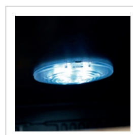
Punto de luz interior