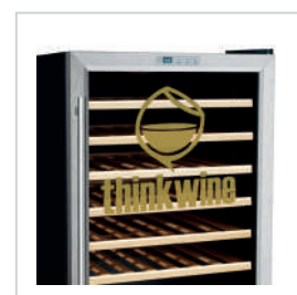
Posibilidad de personalizar la puerta a gusto del cliente